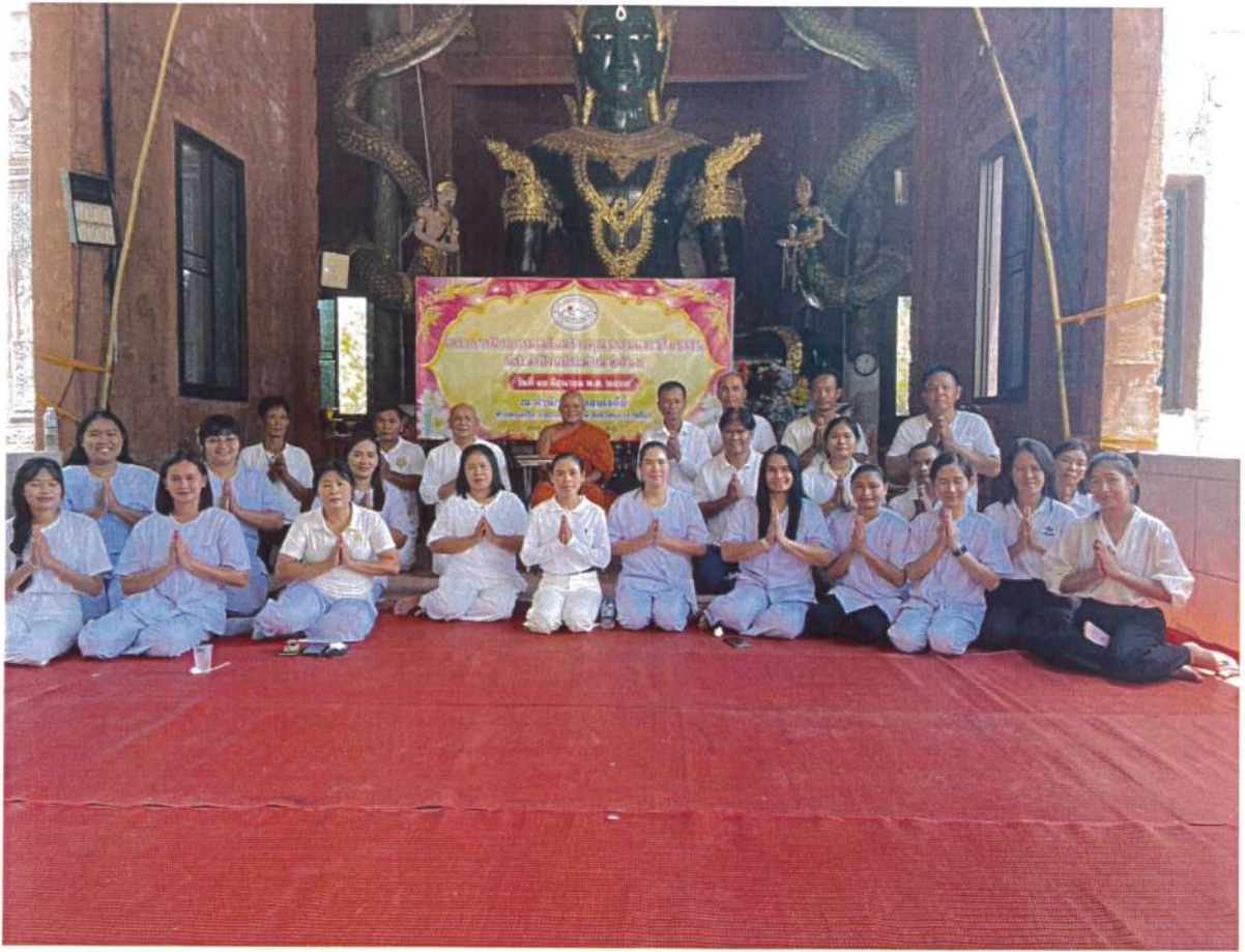
ภาพประกอบกิจกรรมโครงการฝึกอบรมเสริมสร้างคุณธรรมและจริยธรรม ประจำปีงบประมาณ พ.ศ.๒๕๖๘